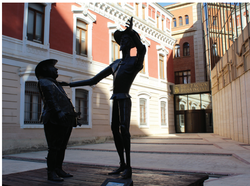
Albacete, Spania – Statuia lui Don Quijote și Sancho Panza