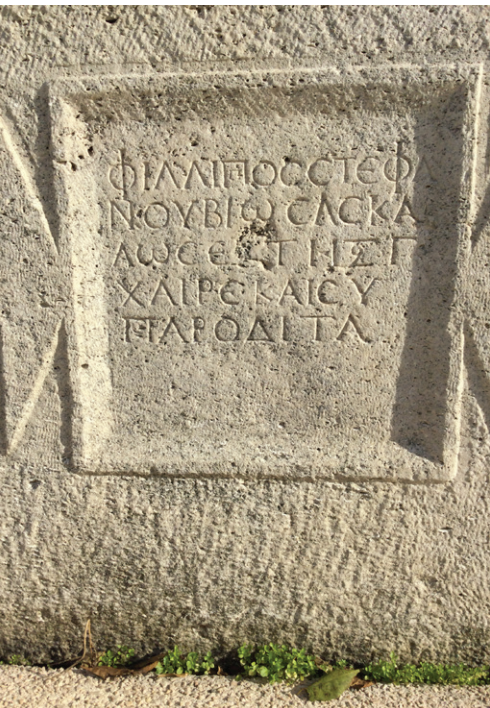
Ruine din cetatea Callatis (Mangalia, azi)