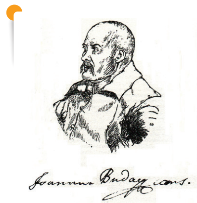
Ion Budai-Deleanu (grafică)

Ion Budai-Deleanu (1760–1820), poet și filolog. Studiază la Blaj, apoi urmează, la Universitatea din Viena, cursuri de filozofie și teologie. Devine bursier al Colegiului greco-catolic „Sfânta Barbara” din capitala Imperiului Habsburgic. Se stabilește la Lemberg (azi – Liov/Lvov, Ucraina), unde își continuă, pe lângă activitățile administrative (consilier aulic, judecător la Curtea de Apel), și munca de filolog. Tipărește, la Viena, prima gramatică a limbii române (alături de Samuil Micu și Gheorghe Șincai). Scrie și opere literare. Capodopera sa este Țiganiada , o „jucărea”, cum o numește autorul însuși, marcată de idei ale Iluminismului european (curent care a pătruns ușor în Transilvania). Compusă în două variante (1800 și 1810), Țiganiada – care s-a bucurat de o glorie postumă – este o epopee eroi-comică, remarcabilă atât prin subiect, cât și prin limbaj și inovații (notele de subsol). Ion Budai-Deleanu este, de asemenea, unul dintre cărturarii de referință ai „Școlii Ardelene”.