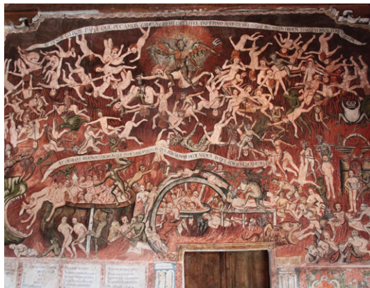
Frescă din biserica San Juan Bautista din Huaró (Peru) care înfățișează iadul

6. Discutați câteva dintre păcatele celor ajunși în iad. De ce sunt socotite ele păcate?