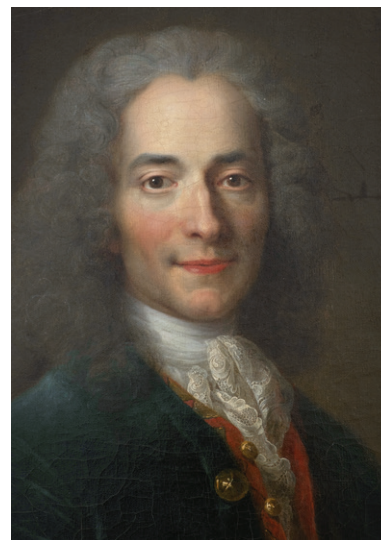
Nicolas de Largillière, portret al lui Voltaire în anul 1718, detaliu

Candide sau Optimismul (1759) este o carte satirică și polemică scrisă de Voltaire, care a dorit să denunțe anumite mentalități și instituții (Inchiziția, de pildă). Călătorind prin diverse locuri, Candide , protagonistul, își schimbă concepția despre lumea în care trăiește, socotită de profesorul său a fi „cea mai bună dintre lumile posibile”. Ororile pe care le observă (crime, abuzuri de tot felul, agresiuni etc.) îl pun pe gânduri. Teoria profesorului său (Pangloss), promovată de Leibniz, este demontată de însăși viața plină de nedreptăți, alcătuită strâmb. Tânărul își găsește, în final, refugiul în muncă, năzuind la „cultivarea propriei grădini”. Cartea este, dincolo de aventurile propriu-zise, o meditație pe tema unei lumi nedrepte și a iluziei fericirii.